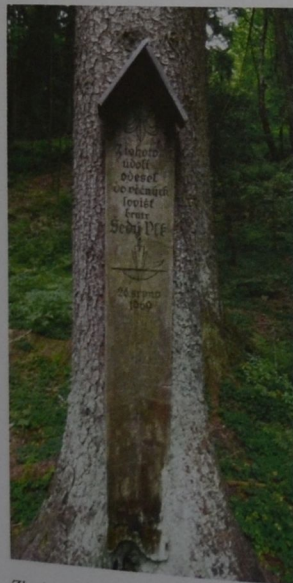
Zbytky skautské chaty Dakota (nahore) Umrličí prkno Šedého Vlka (dole)