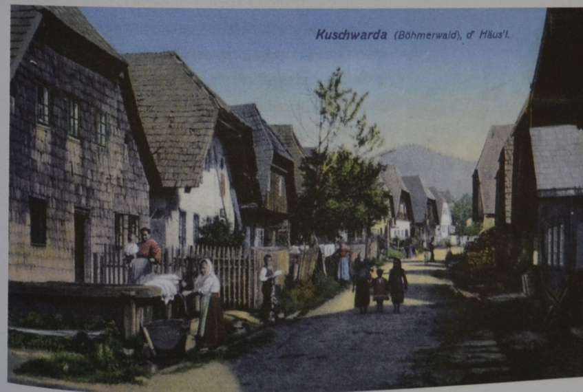
Dobová pohlednice ue Strážného

Na život obce to nemělo velký vliv – dál se rozšiřovala a lákala nové obyvatele. V roce 1843 byl Kunžvart povýšen na městys, dostal znak a právo pořádat trhy. Na konci 19. století zde žilo 845 německých obyvatel. Fungovala obecná škola i tkalcovská škola na zpracování bavlny, pošta, banka, hotely Reif a Paulik, Dammův mlýn,