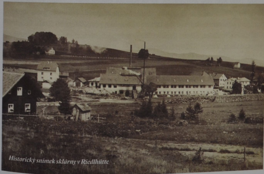
Historický snímek sklárny v Riedlhütte