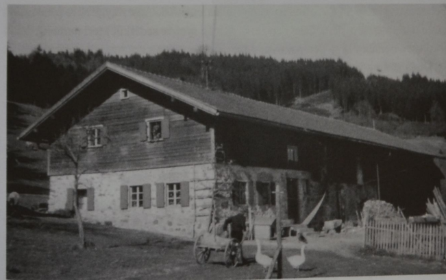
...pak krásný selský statek