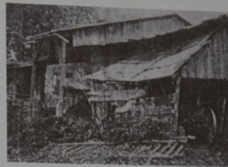
Napřed rozpadlý domek lesních dělníků...

Bavorský les u českých hranic zřejmě neměl v Allgäu příliš dobrou pověst, neboť přátelé a známí Georga Stöckelera varovali: „Nechoď tam, tam vás všechny zapichnou.“ Ten se ale nedal zviklat a 5. května 1935 se s manželkou Mathildou a dětmi