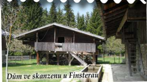
Dům ve skanzenu u Finsterau

lením na in-line bruslích, zastřešeným Světem dětí a bowlingovou dráhou. Geierstahl najdete v sousedství Teisnachu, pouhých deset kilometrů od Bodenmaisu.