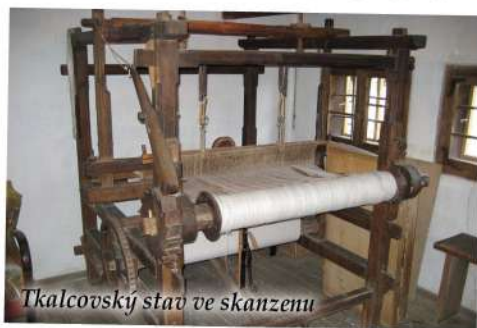
Tkalcovský stav ve skanzenu