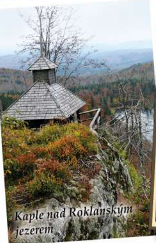
Kaple nad Roklanským jezerem