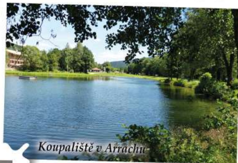
Koupaliště v Arrachu

Rodiny s dětmi mohou využít přírodní Jezerní park s koupalištěm, osůvkem a dobrodružným hřištěm. Arrach sousedí s Lamem a je vzdálený 30 kilometrů od Železné Rudy.