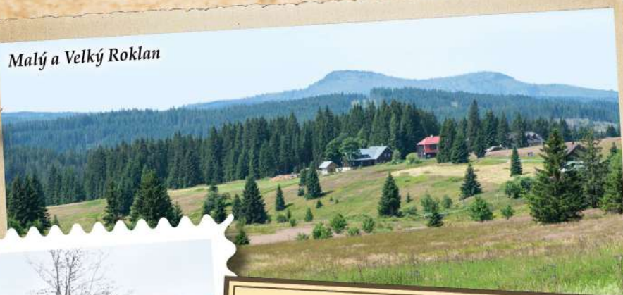
Malý a Velký Roklan

O jezeru se říká, že tam přebývají zakleté duše hříšníků. Pokud tam někdo hodí kámen, vyruší tak tyto přízraky a hladina jezera začne pěnít, vřít a kypět. Nezkoušejte to!