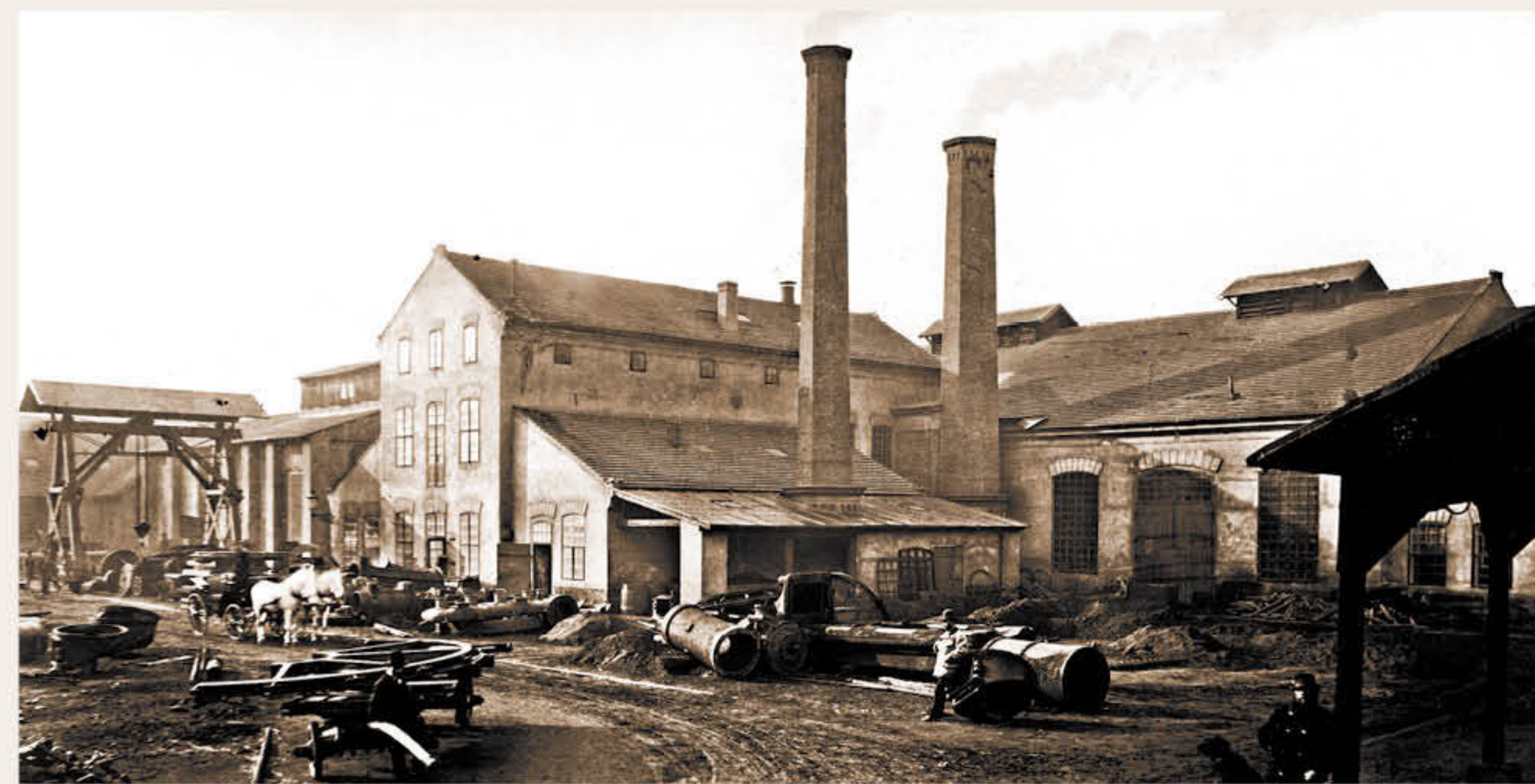
Nádvoří původní Škodovy strojírny v osmdesátých letech 19. století

Je nad slunce jasnější, že k vedení gigantického podniku nestačil jen specialista s odbornými znalostmi, ale především geniální manažer obdařený organizačním talentem pro řízení velkých týmů. Opa osobně řídil celý kolos a jedovatě jazýčky leckdy štípaly, že šéf je ve fabrice vrchní policajt, chce být u všeho, co se kde šustne, a rozhodovat o všem jako za starých dávných časů. Sám!